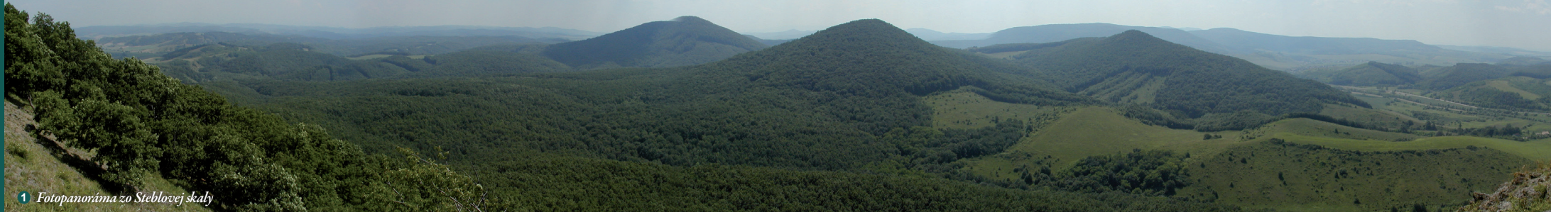
1 Fotopanoráma zo Steblovej skaly

V záujme udržateľného rozvoja združenie aktívne spolupracuje s miestnymi samosprávami, základnými, strednými a vysokými školami, odbornými a rozvojovými organizáciami, občianskymi združeniami a miestnymi podnikateľmi.