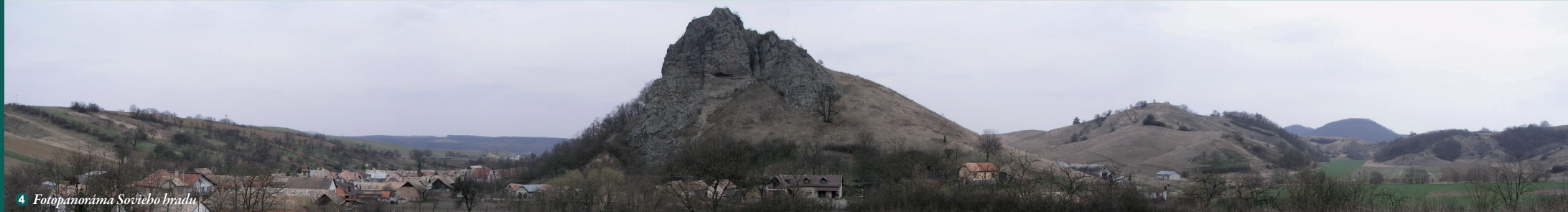
4 Fotopanoráma Sovieho hradu