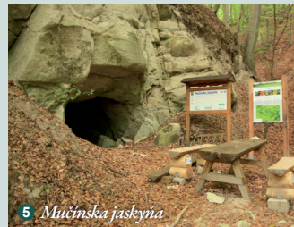
5 Mučinská jaskyňa

Na Slovensku sa geopark rozprestiera na území okresov Lučenec (mesto Filakovo a obce: Belina, Biskupice, Čakanovce, Čamovce, Filakovské Kováče, Lipovany, Kalonda, Mučín, Pleš, Prša, Radzovce, Rapovce, Ratka, Šiatorská Bukovinka, Šurice, Šíd, Trebelovce) a Rimavská Sobota (obce: Blhovce, Dubno, Gemerský Jablonec, Hajnáčka, Nová Bašta, Petrovce, Stará Bašta, Studená, Tajchy, Večelkov), kde sa nachádza spolu 53 lokalít: geologická lokalita (15), kultúrno-historická (11), montanistická (3), archeologická (3), prírodná (2), oddychová (1), zmiešaná (18) geologická a montanistická (9), geologická a prírodná (6), geologická, prírodná a archeologická (2), geologická,