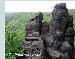
7 Pohanský hrad

Gestorom budovania geoparku je Združenie právnických osôb Geopark Novohrad-Nógrád , ktoré bolo zriadené v roku 2008. Združenie zastrešuje strategické, plánovacie, rozvojové, výchovno-vzdelávacie a prezentačné aktivity v rámci územia UNESCO geoparku, je súčasťou