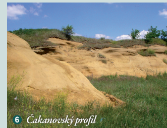
6 Čakanovský profil