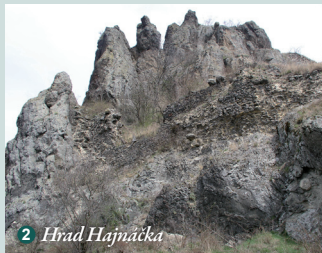
2 Hrad Hajnáčka