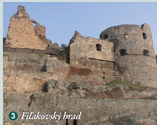
3 Filakovský hrad

Národná prírodná rezervácia Pohanský hrad, Národná prírodná rezervácia Ragač, Prírodná rezervácia Hajnáčsky hradný vrch, Prírodná rezervácia Steblová skala, Prírodná pamiatka Soví hrad a mnohé ďalšie geologické, prírodné a kultúrno-historické lokality.